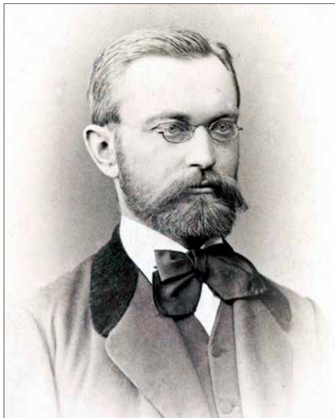
Wojciech Kętrzyński - portret z 1881r.

działalność. Przebywał w Wilnie, w Królewcu zajmował się pośrednictwem w transportach broni do powstańczych oddziałów. Przewożąc broń, został zatrzymany w Olsztynie, pięć dni więziony w Górnej Bramie, a następnie uwolniony przez olsztyński sąd od zarzutów działalności antypaństwowej. Uwolnienie było jednak krótkie, gdyż niedługo po tym został ponownie aresztowany, a sąd berliński skazał go na karę roku pobytu w twierdzy, którą odsiedział w twierdzy w Kłodzku. Po wyjściu z więzienia Kętrzyński ukończył studia i obronił pracę doktorską. Nie mając stałego zatrudnienia,