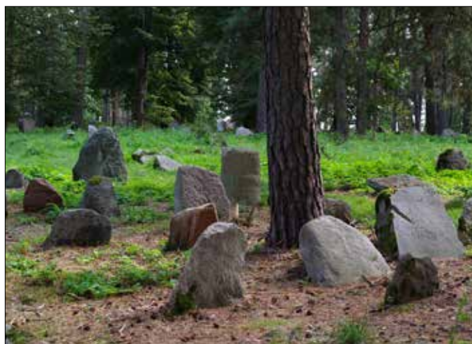
Cmentarz muzułmański w Kruszynianach, 2 poł. XVII w.

Powyższe słowa stanowią zarys zasad dialogu międzykulturowego, które powinny być brane pod uwagę w kontekście obecności w tym dialogu nie „tylko i po prostu” chrześcijan, ale także teologów i teologii.