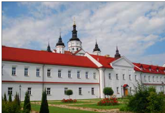
Monaster Zwiastowania Przenajświętszej Bogarodnicy w Supraślu

się odrębnych tekstów, innych szat i celebryje się w różnych językach (przykładem są formy liturgiczne, takie jak syryjska, koptyjska, malabarska). Swoistym pomnikiem jest też teologia, która fundamentalną treść czerpie co prawda z Biblii, ale już swoje specyficzne formy ekspresji wywodzi zarówno z Biblii, jak i z filozofii greckiej.