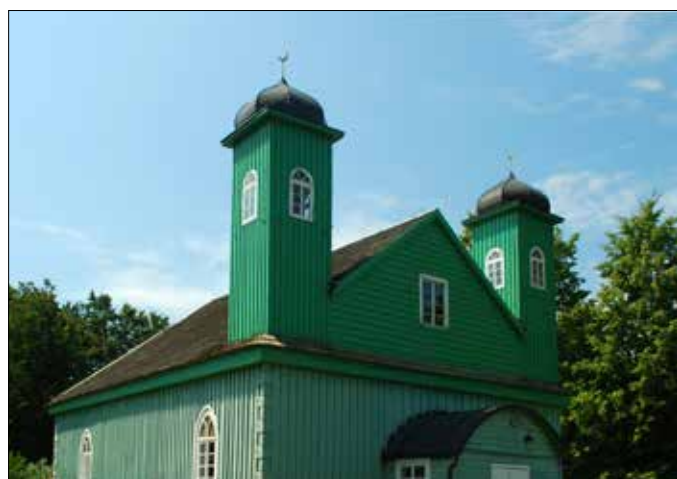
Meczet tatarski w Kruszynianach, XVIII/XIX w.